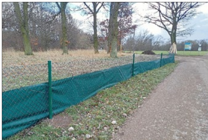
Bereits umgesetzter Amphibien- und Biberschutzzaun an der zukünftigen Baustraße

Eine weitere Voraussetzung für die anstehenden Verwehrarbeiten ist der Rückbau der 3 vorhandenen Bohrtürme. Die dafür erforderliche Planung der Rückbauarbeiten befindet sich momentan in der Bearbeitung. Der Rückbau selbst ist für den Zeitraum Ende 2023 bis Mitte 2024 vorgesehen.