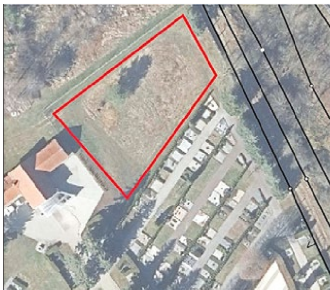
vorgesehene Fläche auf dem Friedhof in Stadtilm

Mit Änderung der Friedhofsnutzungssatzung vom 23.03.2023 wird es zur Jahresmitte- vorerst nur auf dem Friedhof Stadtilm- die Möglichkeit der Beisetzung in einer Baumgrabstätte geben. Damit kann nun dem lang gehegten Wunsch der Bürgerinnen und Bürger sowie der Verwaltung entsprochen werden. So wird neben den Stelen eine weitere Möglichkeit der halbannymen Bestattung geboten. Auch hier sind neben gleicher Kostengestaltung ähnliche Regelungen gegeben wie bei den Urnengemeinschaftsgrabstätten mit Namensnennung. Eine Weymouthskiefer, eine Platane, eine Kaiserlinde und künftig eine Himalayabirke werden zur Nutzung als Baumgrabstätten zur Verfügung stehen.