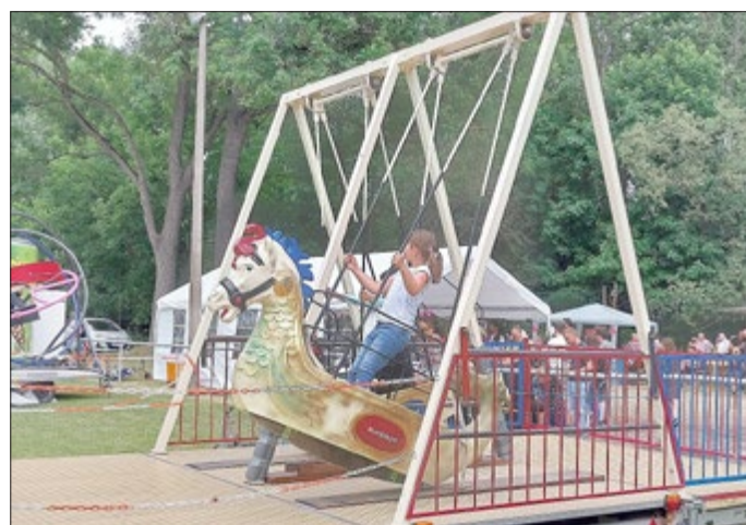
Wir sagen ein herzliches Dankeschön!

Die Spiel-, Sport- und Bastelattraktionen an diesem Tag sind kostenfrei für Kinder! Davon ausgenommen Karussellfahrten und die Verpflegung!