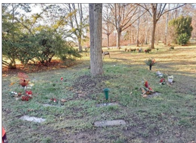
Beispielfoto: hier Friedhof in Erfurt

Vorgesehen ist die Kennzeichnung der Urnenplätze mit Platten (Vorname/ Name, Geburts- und Sterbejahr). Diese werden kreisförmig um den jeweiligen Baum angeordnet.